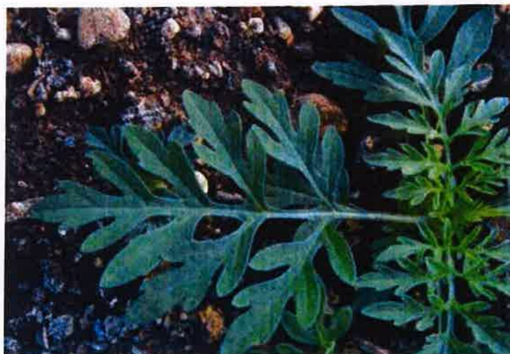
■ Sattgrüne Farbe der Blätter, weißliche Nervatur